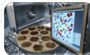
Caracterização tecnológica e petrofísica