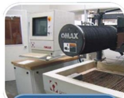
Mecânica de Rochas (LMR)