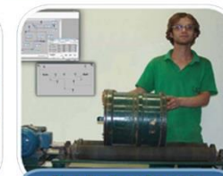
Simulação e Controle de Processos de Trat. de Minérios (LSC)