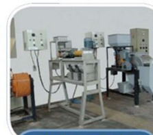
Tratamento de Minérios e Resíduos Industriais (LTM)