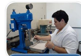
Físico-Química de Interfaces (LQFI)