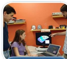
Planejamento e Otimização de Lavra (LAPOL)