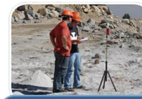
Controle Ambiental, Higiene e Segurança na Mineração (LACASEMIN)