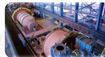
Tratamento de minérios