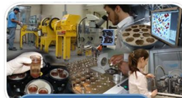
Caracterização Tecnológica (LCT)